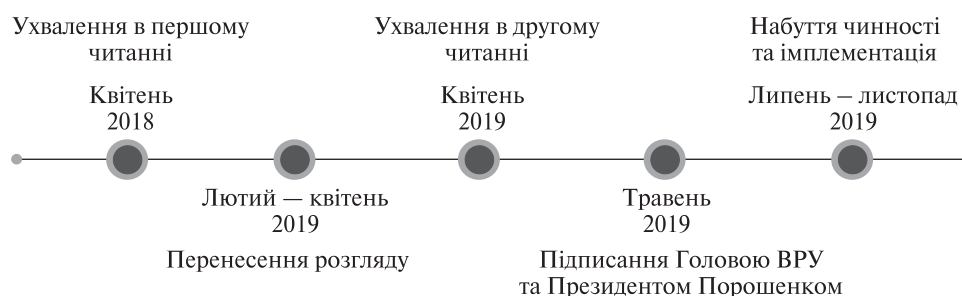
Схема 2. Хронологія ухвалення Закону України «Про забезпечення функціонування української мови як державної»

милок. Однією з таких було небажання його команди чіпати мову до президентських виборів» [10]. З одного боку, ситуація з підписанням мовного закону в останні дні каденції нагадує історію мовної політики України в постпомаранчевий період. Так, в останні дні перебування В. Ющенка на посаді Президента України, тодішній віцепрем'єр-міністр із гуманітарних питань В. Кириленко підписав указ про запровадження іспитів з української мови для державних службовців. Більш ніж очевидно, що за президентства В. Януковича це рішення не було втілено в життя. З іншого боку, суттєва відмінність постпомаранчевої та постмайданної України полягає в тому, що тепер в країні повноцінно функціонує громадянське суспільство, яке бере на себе функцію, як розробки, підтримки нових законів, так і контролю їх належного виконання, це стосується і мовного законодавства.